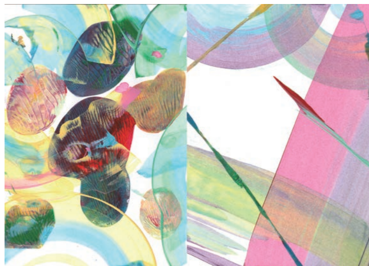
受講生作品 色彩表現(ゴムペラを使って)